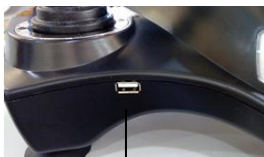
Port USB do podłączenia XBOX ONE/PS4