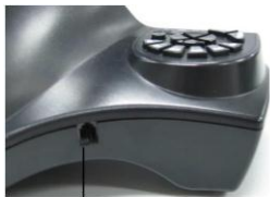
Port do podłączenia pedałów