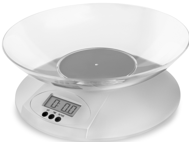
Waga kuchenna MKS301