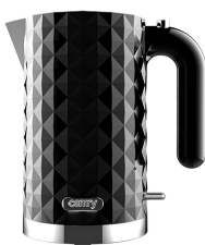
Electric Kettle CR 1269