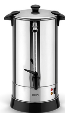
Electric Boiler CR 1267