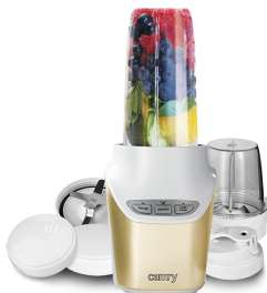
Personal Blender CR 4071