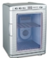
Mini-fridge CR 8062