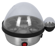
Egg Boiler CR 4482