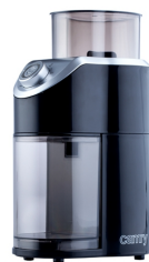
Burr Coffe Grinder CR 4439