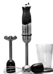
Hand blender CR 4612