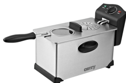
Deep Fryer CR 4909