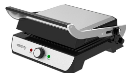
Electric Grill CR 6609