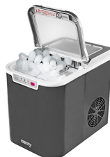
Ice Cube Maker CR 8073