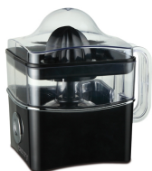
Citrus juicer CR 4001