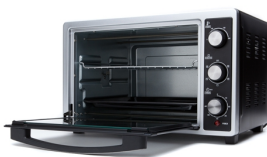
Electric Oven CR 6018