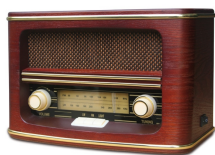
Retro Radio CR 1103