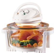
Halogen Oven CR 6305