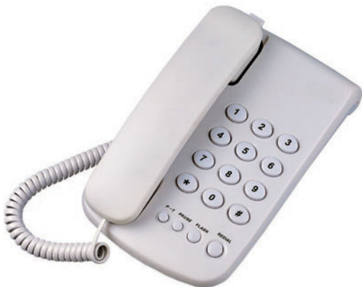
Aparat telefoniczny przewodowy