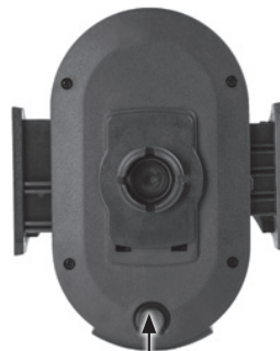
Przycisk do automatycznego wysuwania ramion bocznych

Umieść urządzenie w uchwycie a następnie delikatnie ściśnij boczne ramiona, aż do wyczucia oporu. Sprawdź poprawne mocowanie telefonu w uchwycie, tak aby boczne trzymanie było stabilne i nie doprowadziło do wysunięcia się telefonu z uchwytu i jego uszkodzenia.