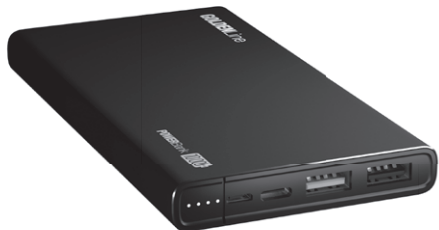
POWER BANK PBA10000*PD