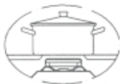
PALNIK DUŻY I ŚREDNI Średnica garnka 14-22 cm

Ciężar garnka wraz z zawartością nie może przekroczyć 10 kg.