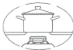
PALNIK MAŁY Średnica garnka 10-14 cm