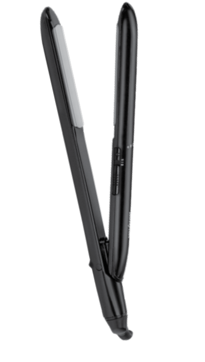
Babybliss ST241E, de tweede generatie